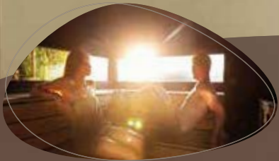
8 heerlijke sauna's